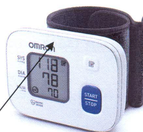
Место нанесения защитной наклейки Рисунок 2– OMRON RS2 (HEM-6121-RU)