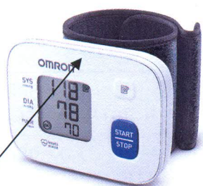
Место нанесения защитной наклейки Рисунок 1 – OMRON RS1 (HEM-6120-RU)