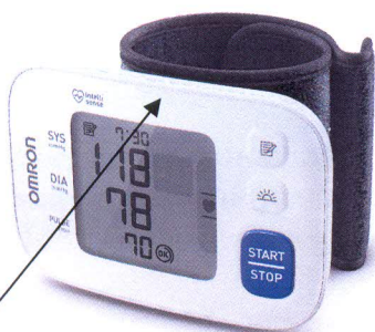
Место нанесения защитной наклейки Рисунок 3 – OMRON RS3 (HEM-6130-RU)