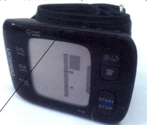
Место нанесения защитной наклейки Рисунок 5–Модель OMRON RS8(HEM-6310F-E)