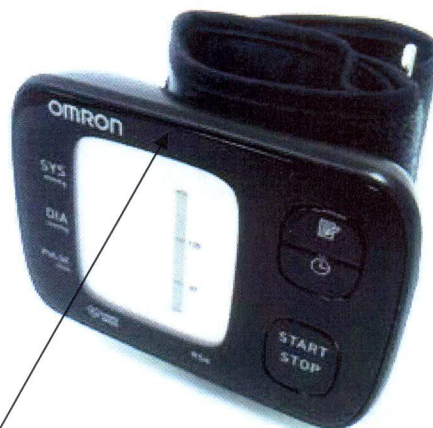
Место нанесения защитной наклейки Рисунок 4 – OMRON RS6 (HEM-6221-RU)